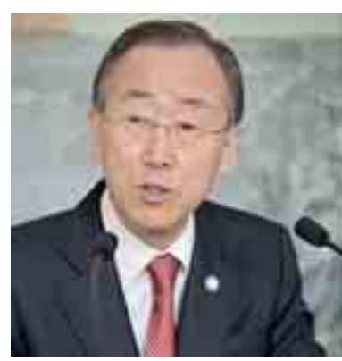
IL SEGRETARIO ONU, BAN KI-MOON

NATO. La Nato segue con grande preoccupazione la situazione in Libia e si prepara «ad ogni eventualità». Con una dichiarazione di poche righe, il segretario generale Anders Fogh Rasmussen