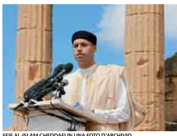
SEIF AL-ISLAM GHEDDAFI IN UNA FOTO D'ARCHIVIO

surata. Mohammed, il primogenito, è invece pressoché sparito dalle cronache, mentre Mutassim è consigliere per la politica di sicurezza nazionale, dopo che in passato un duro scontro con il padre lo portò a scappare in Egitto. Chissà che non sia proprio lui a nascondersi tra le palme dell'Isla Margarita.